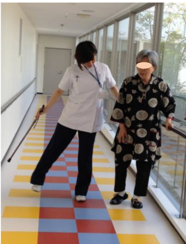
スクエアステップ訓練を実施中 (デイサービス なの花)

雨の日でも歩行訓練ができるデイサービスなの花 ふらつきを防止するための筋力(中臀筋)を鍛える横歩きの 訓練や視覚からの情報を取り入れた訓練をします。